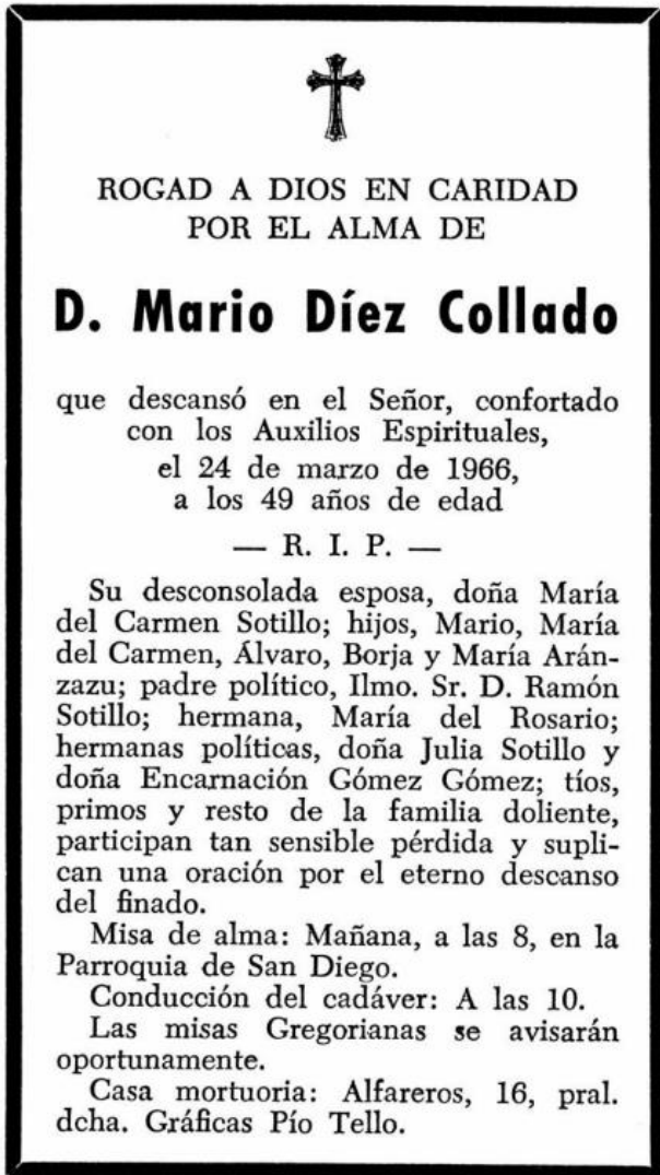
Esquela con la que se abre la novela.

La novela empieza de una forma rotunda. Con una esquela, ese aviso de la muerte de una persona que se publica en los periódicos con recuadro de luto. Suele indicar la fecha y el lugar del entierro, funeral, etc.